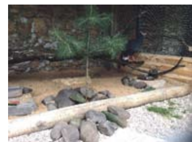
Na pierwszym planie kiściec srebrzysty