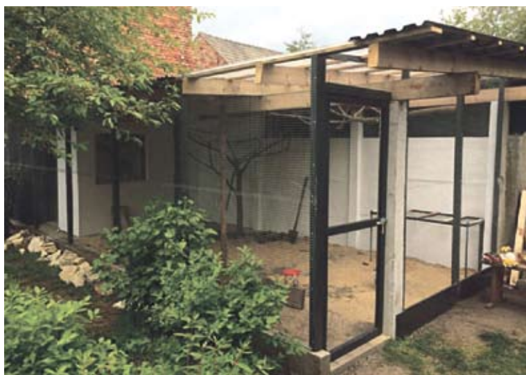
Pomieszczenia gotowe na przyjęcie pierwszych mieszkańców

wymieniać spostrzeżenia oraz dzielić się doświadczeniami hodowlanymi, które są często tematem długich dyskusji. W skrócie - głównym założeniem i celem działalności WPA na świecie jest ochrona