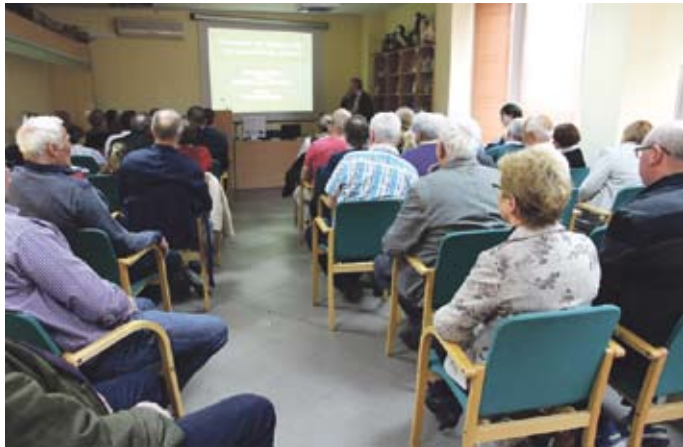
Wykłady w sali konferencyjnej Warszawskiego zoo podczas inauguracyjnego spotkania w Warszawie w 2015 roku

Dzień dobry, w bieżącym numerze przedstawię Państwu międzynarodową organizację The World Pheasant Association (Światowe Towarzystwo na Rzecz Ochrony Bażantów), w skrócie WPA, zajmującą się ochroną ptaków z rzędu grzebiących, głównie bażantów.