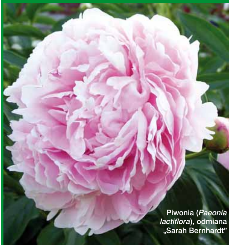
Piwonia ( Paeonia lactiflora ), odmiana „Sarah Bernhardt”

Do rodzaju piwonia ( Paeonia L. ) należy ok. 40 gatunków roślin. Pochodzą głównie z obszarów Europy i Azji. Gatunkiem typowym jest Paeonia officinalis L. Piwonie posiadają różnokolorowe – białe, różowe, purpurowe, rzadziej żółte - kwiaty. Odmiany mieszane mają kwiaty dwubarwne i pełne